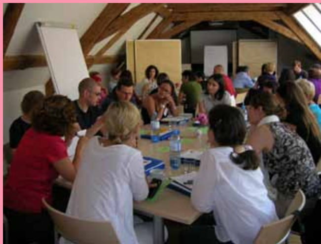
Atelier avec les chercheurs et les organisations de la société civile en Autriche

Pour savoir plus sur les événements à venir et sur les services qui pourraient vous intéresser, vous pouvez consulter le site web de GEMMA et souscrire au bulletin d'information que vous pouvez trouver sur http://www.gemmaproject.eu